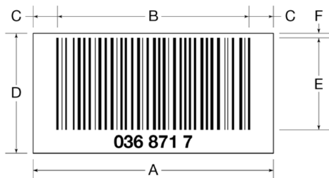
Slika 2 Dimenzije bar-koda